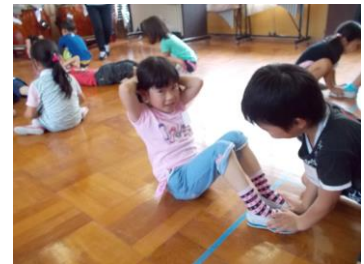
【いい声は腹筋から】

通常の授業より15分も長い60分間の学習活動でしたが、あっという間でした。1時間目の活動で全員が自分の感想を発表することができたので、活動の振り返りは、各校各学年の計4名が代表して行いました。