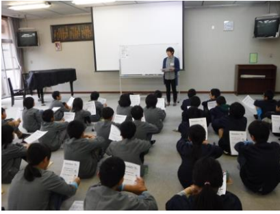
【養護教諭より健康管理について】