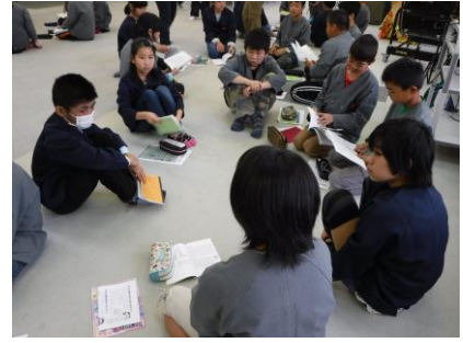
【班ごとの話し合い】

5校の6年担任と修学旅行の引率をする養護教諭を児童に紹介し、体調管理の仕方や大切なポイントについて話をしてもらいました。その後、各校で作成してきたしおりを使ってねらいや約束を確認し、班ごとに分かれてめあてを立て、JRやバスの座席を決めました。休憩の後、戦争についての事前学習としてDVD「夏服の少女たち」を鑑賞し、感想を書いて班で交流をしました。