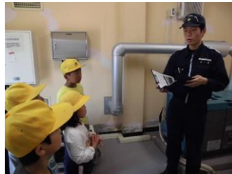
【職員より灯台についての説明】