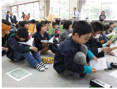
【しおりの説明を聞く】