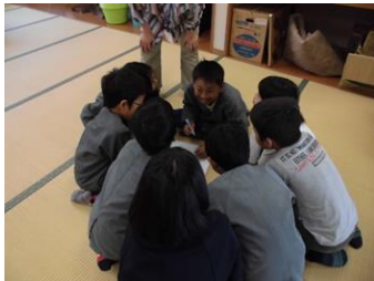
【自己紹介・他己紹介】